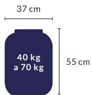
BOMBONA DE 50 LITROS