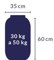
BOMBONA DE 40 LITROS

Veja a seguir alguns tipos de embalagens que podem ser usadas, além da capacidade aproximada de pilhas e baterias portáteis pós-consumo que podem ser armazenadas. Escolha bombonas com tampa e preferencialmente com alça.